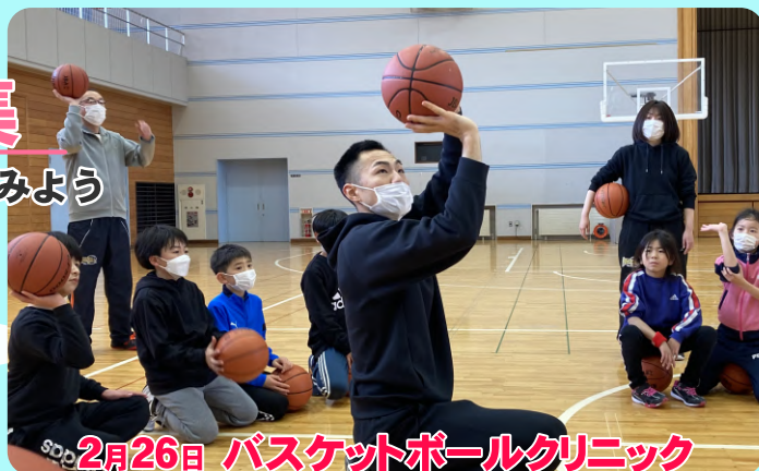
2月26日 バasketボールクリニック